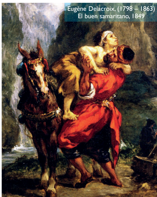
Eugène Delacroix, (1798 – 1863) El buen samaritano, 1849

ser Iglesia sensible al sufrimiento de los demás, que se conmueve ante el dolor ajeno y que busca los medios para sanarlo. Una Iglesia samaritana es aquella que reconoce a todo hombre como su prójimo y le ama quien quiera que sea. Si así actúa, entonces esta comunidad, aunque sea pequeña y sencilla, será para los demás signo de un Dios que es todo Él misericordia.