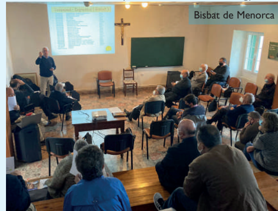
Bisbat de Menorca

recordant que l'economia de la diòcesi de Menorca està sempre al servei de l'acció pastoral, caritativa i social. Totes aquestes qüestions econòmiques estan a la disposició dels fidels i de qualsevol persona interessada al Portal de Transparència que poden trobar a la web del Bisbat de Menorca ( bisbatdemenorca.org ).