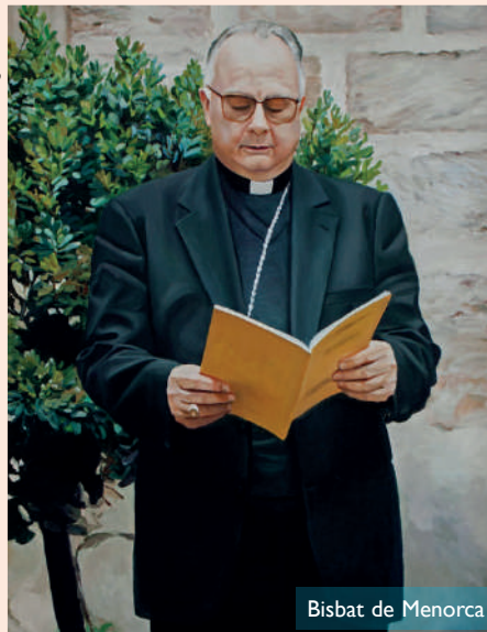
Bisbat de Menorca

La matinada del dimecres 11 de novembre, va morir Monsenyor Francesc Xavier Ciuraneta, al seu domicili de Palma d'Ebre (Tarragona), a l'edat de 80 anys després d'una llarga malaltia. Va ser ordenat sacerdot el 1964 a Tortosa. El 14 de setembre de 1991 va ser ordenat bisbe de Menorca a la Catedral, amb l'assistència del Nunci a Espanya. El dissabte passat es va celebrar una missa funeral presidida pel bisbe Francesc a la Catedral de Menorca per a recordar amb afecte i agraïment el bisbe Ciuraneta, que durant vuit anys va ser el pastor de l'Església de Menorca fins el 1999, any en el qual va ser nomenat bisbe de Lleida. En l'actualitat, era bisbe emèrit d'aquesta diòcesi catalana. En la seva homília, el bisbe Francesc va des-