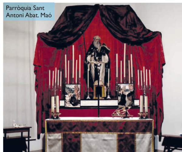
Parròquia Sant Antoni Abat. Maó