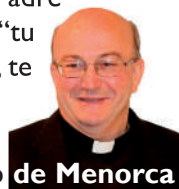
† Francisc, Obispo de Menorca

Como decía san Pedro Crisólogo, la oración, los gestos de caridad y el ayuno son una sola cosa, porque estos medios se apoyan entre ellos. Al hacerlos, llevemos mucho cuidado de no practicarlos para ser aplaudidos por los demás. Jesús nos pidió orar en lo secreto, dar limosna sin tocar la trompeta y perfumarse el día de ayuno (Mt 6, 1-18). Sólo nuestro Padre celestial debe saberlo. Y así "tu Padre, que ve en lo secreto, te recompensará" (6, 18).