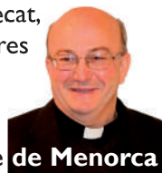
† Francesc, Bisbe de Menorca

No tinguem por d'apropar-nos a ell i contemplar la creu en totes les seves dimensions. Durant aquesta Setmana Santa que començam, alcem els nostres ulls per mirar la creu i omplir-nos de vida. Com els jueus al desert miraven l'estendard amb la serp que Moisès havia aixecat, nosaltres elevem els nostres ulls per omplir-nos de vida.