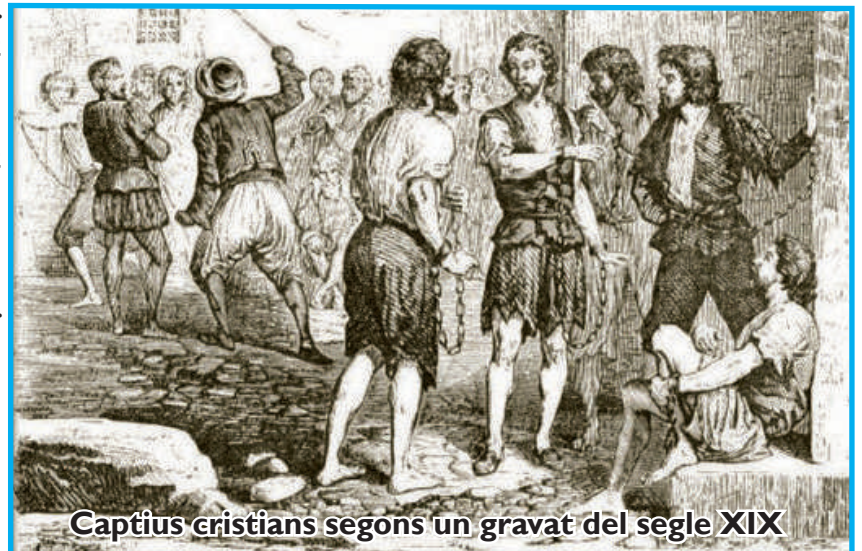
Captius cristians segons un gravat del segle XIX