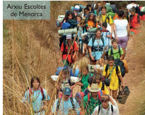
Anxiu Escoltes de Menorca

l'assumpció personal dels valors de la llei escolta i guia. Assumir un compromís davant del grup autoeduca a la persona. Des de la seva entrada al grup, el filllet o filleta assumeix responsabilitats pròpies de la seva edat i d'acord amb les seves capacitats.