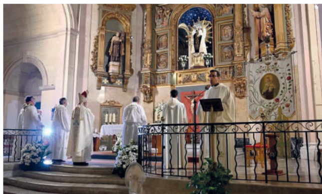
Mare de Déu del Carme a la parròquia del Carme de Maó