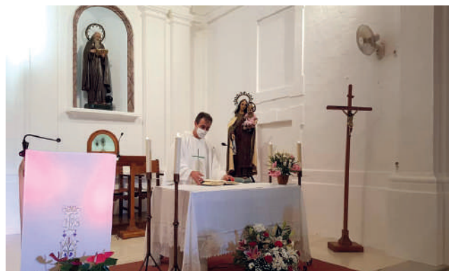
Mare de Déu del Carme a la parròquia de Sant Antoni Abat de Fornells