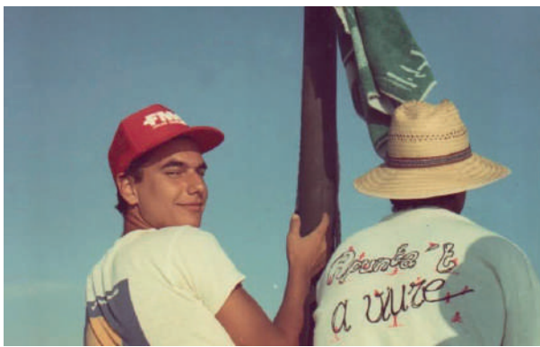
Foto de quan anava al Club Juvenil de Sant Francesc de Maó.