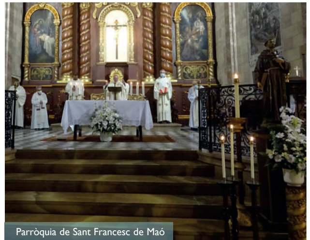
Parròquia de Sant Francesc de Maó