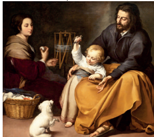
Sagrada Familia Bartolomé Esteban Murillo - Museo del Prado

El Papa Francisco subraya dos características de este amor. La primera es que se vive en la vida cotidiana, la cual está hecha muchas veces de cansancios y sufrimientos, como cuando la Sagrada Familia tuvo que sufrir la incomprensible violencia de