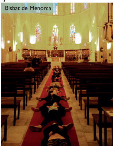
Bisbat de Menorca

Presentada la Catedral com un llibre amb pàgines de pedra, la programació inclou diverses tècniques pedagògiques per deixar-se sorprendre i fascinar per la bellesa de l'espai arqui-