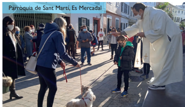
Parròquia de Sant Martí, Es Mercadal