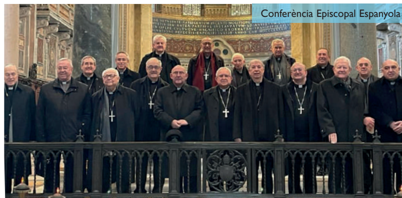
Conferència Episcopal Espanyola