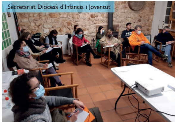
Secretariat Diocesà d'Infància i Joventut

Aquest any s'ha pogut fer la formació d'agents de pastoral de forma presencial. Va tenir lloc els dies 5 i 6 de febrer a la casa de colònies de Sant Joan de Missa. Van