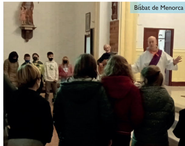
Bisbat de Menorca

Des d'aquí vull donar les gràcies a l'equip del Secretariat i als animadors dels diferents grups d'infants que hi ha dins les nostres comunitats per fer possible aquesta experiència d'acompanyament als més petits. Déu ens estima amb amor gratuït i sense límits i ens crida a treballar pel regne del Cel.