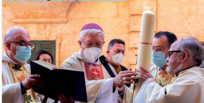
Catedral, Vigília Pasqual