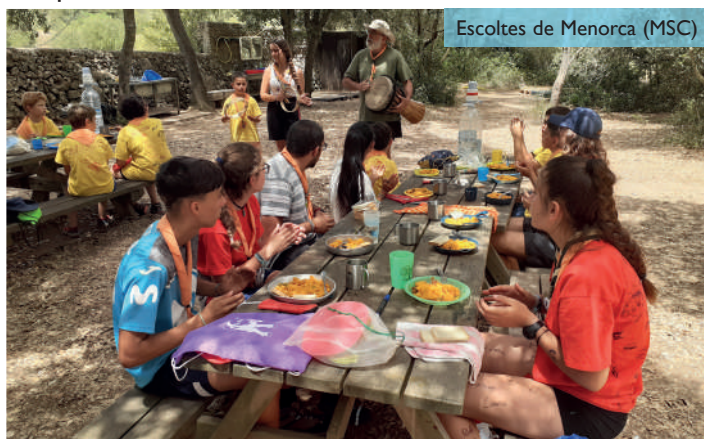
Escoltes de Menorca (MSC)

Acompanyats per Victor Eguriase Uwagba, contacontes i percussionista, el grup va gaudir d'un viatge imaginari per l'Àfrica, des de Mahikeng (Sud-àfrica), on Baden Powell va tenir les primeres intuïcions sobre el mètode escolta, fins a Nyeri (Kènia), on es pot visitar la tomba del Fundador. Finalment, distribuïts per tribus van celebrar una Cimera del Clima en la qual els membres de les 5 tribus dels 5 continents van fer les seves reflexions i aportacions sobre la realitat del canvi climàtic. Aquesta activitat ha tingut el suport del Departament de Joventut del CIME, Fundació Guillem Cifre de Caixa Colònia i la Cooperativa San Crispín.