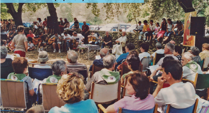
Trobada dels Equips. Any 2004