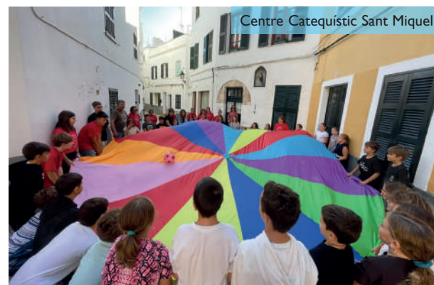
Centre Catequístic Sant Miquel

El diumenge 2 d'octubre, la celebració de l'Eucaristia va ser presidida per l'Administrador diocesà, Mn. Gerard