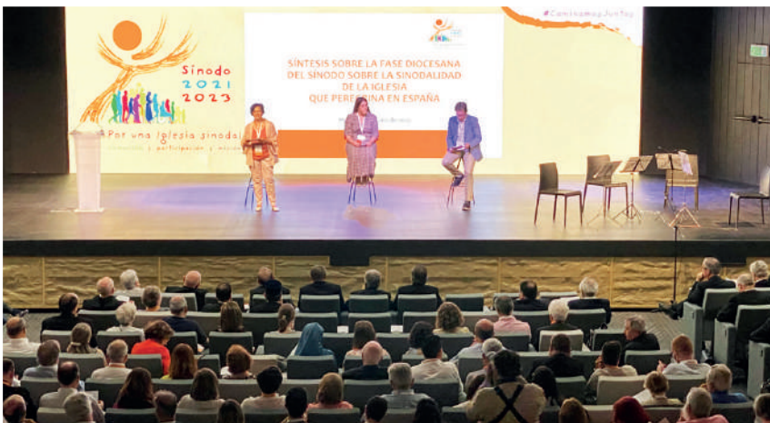
Assemblea final del Sínode a Madrid. Juny 2022

La pregària va ser un dels elements que va marcar la trobada –i de la fase diocesana-, des del seu començament, fins al final. Tots érem conscients que aquest era el secret de la nostra sintonia, que no es basava en les relacions humanes, entre per-