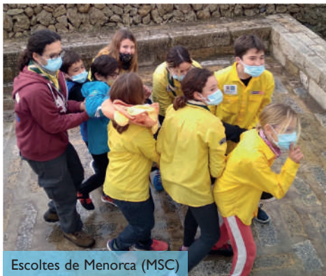
Escoltes de Menorca (MSC)

Infants i joves són els protagonistes actius de les activitats, (jocs, empreses, serveis..., ja que han participat en tot el procés: tria, presentació, elecció, acció i revisió. I tot això, amb l'acompanyament de caps i responsables.