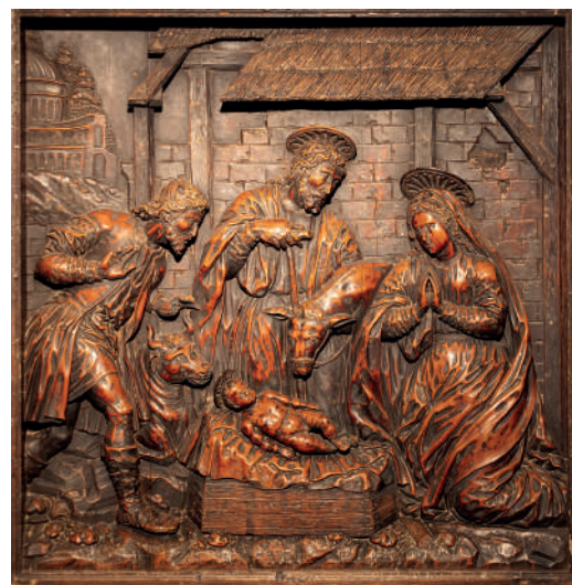
Relleu de la Nativitat del Reial Monestir de Santa Clara de Ciutadella

Muchísimas felicidades para todos en esta fiesta de Navidad, siempre con mucho ánimo y esperanza.