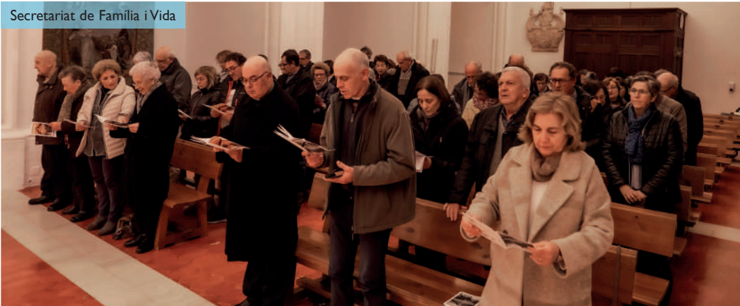
Pregària familiar al Santuari de la Mare de Déu del Toro. 12 de febrer de 2023