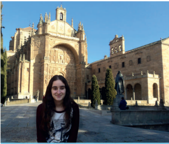
En el fondo Convento e Iglesia de San Esteban (Salamanca)