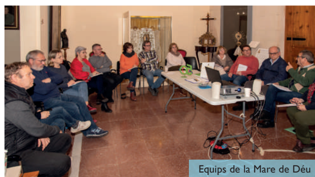
Equips de la Mare de Déu

Els Equips de la Mare de Déu han celebrat a Menorca la seva reunió trimestral de responsables de tots els sectors de la regió de Catalunya