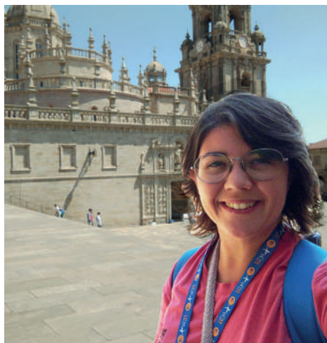
Foto del verano pasado en la PEJ (Peregrinación Europea de Jóvenes) en Santiago de Compostela (2022)

Para un joven es muy importante tener auténticos referentes en su vida. En mi caso, han sido y son: mis padres, mi hermano y el resto de mi familia; mis profesores y Hermanos de La Salle; mis catequistas, amigos, personas consagradas, sacerdotes... Gracias a ellas, y a todas las experiencias que han ido dejando huella en mi historia personal,