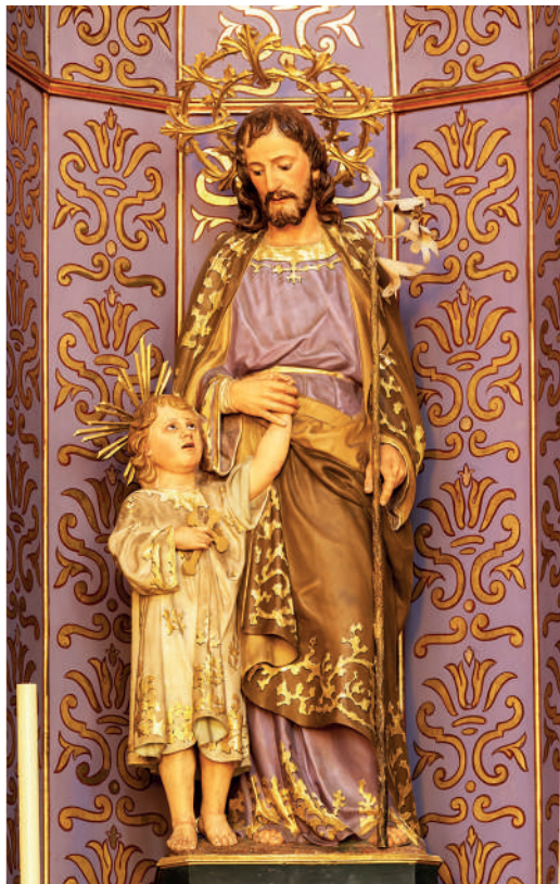
Imatge de Sant Josep Catedral de Menorca Toni Barber

Quan xerram de somnis ens pensam que són imaginacions que produeix la nostra ment, especialment durant la nit, o també diem que són somnis aquelles realitats o desitjos que difícilment són realitzables. Però els somnis de Déu, els seus desitjos i anhels, són assumibles si troba persones que estiguin disposades a dir que sí. Dins el pla de salvació el Pare del cel es va trobar amb els