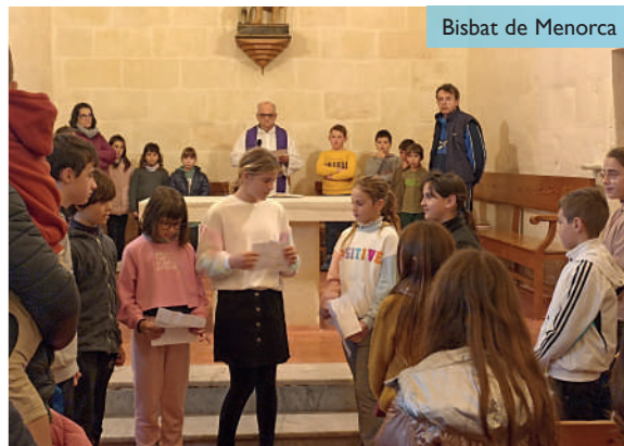
Bisbat de Menorca

El 4 de març els grups de catequesi de la parròquia de Sant Antoni Maria Claret (Ciutadella) van anar d'excursió a Sant Joan de Missa. Es van fer diferents jocs com