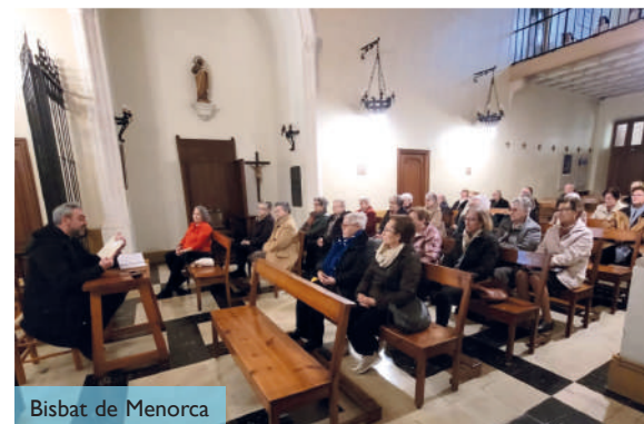
Bisbat de Menorca