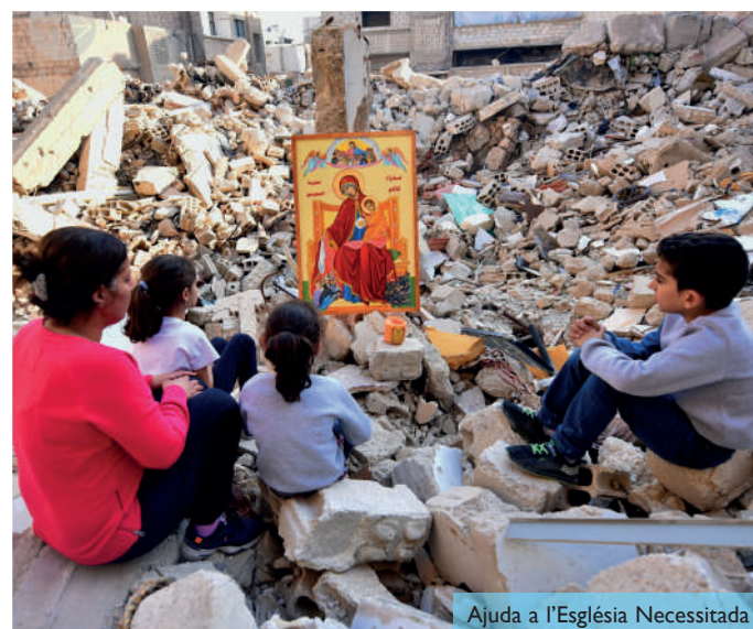
Ajuda a l'Església Necessitada