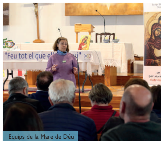
Equips de la Mare de Déu