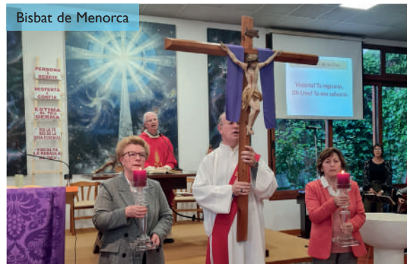
Divendres Sant. Parròquia de Sant Esteve