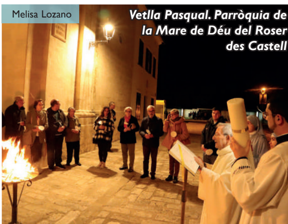
Vetlla Pasqual. Parròquia de la Mare de Déu del Roser des Castell