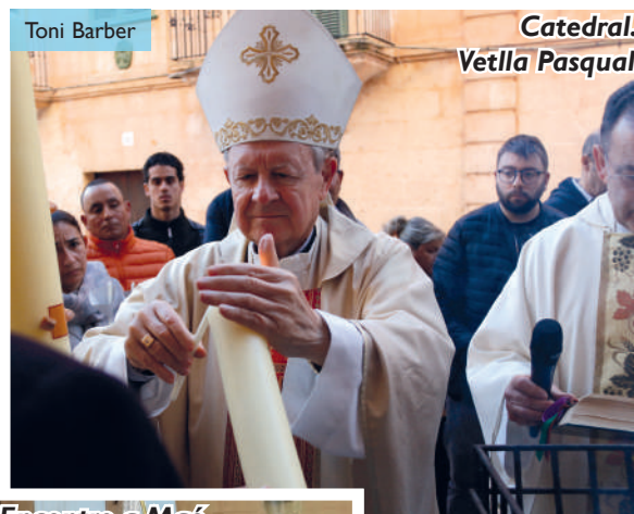
Catedral. Vetlla Pasqual