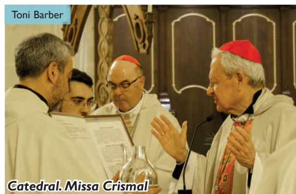
Catedral. Missa Crismal

El Dijous Sant, inici del Tridu Pasqual, també va ser el dia l'Amor Fraternal. En aquest sentit, el Bisbe va destacar que "no es tracta simplement de tenir bons sentiments, que abunden i són molts, sinó de viure amb alegria aquest camí d'amor que Jesús proposa i que es realitza en gestos concrets de servei, d'ajuda, de perdó." En la Vella Pasqual, es va entrar als temples il·luminats per la Llum del ciri pasqual que representa la de Crist Ressuscitat. "La Resurrecció no és una cosa del passat, sinó una força, una realitat del nostre present. Crist ha ressuscitat i nosaltres amb ell", va ressaltar Mons. Javier Salinas.