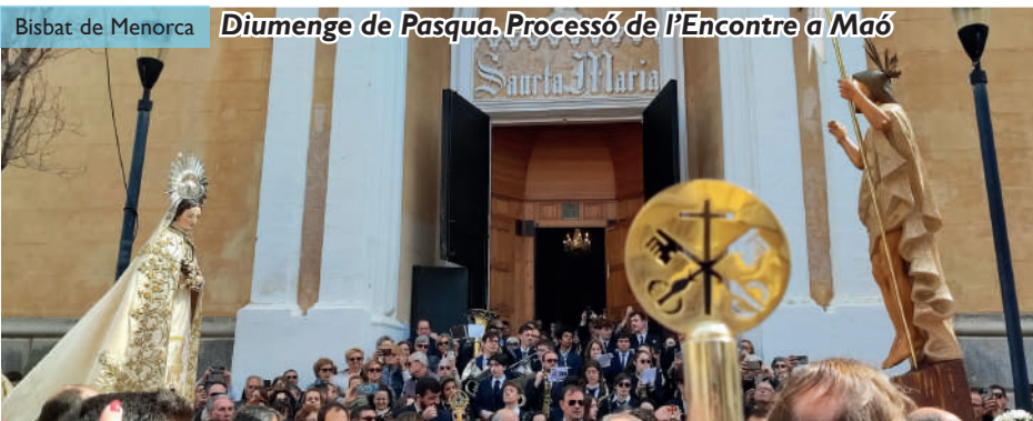
Diumenge de Pasqua. Processó de l'Encontre a Maó

Trobareu més informació i fotografies de les celebracions de Setmana Santa a la pàgina web del Bisbat de Menorca ( bisbatde menorca.org ).