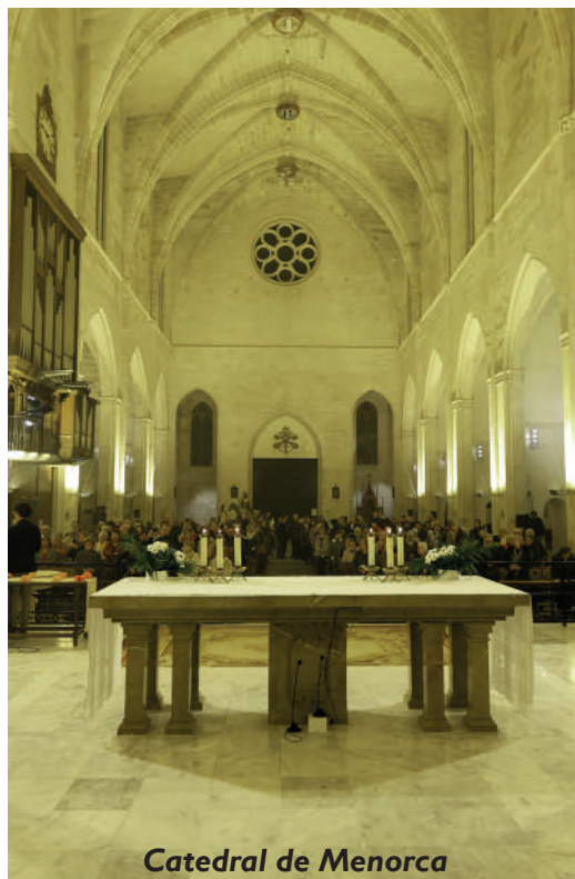
Catedral de Menorca