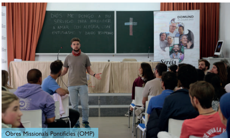
Obres Missionals Pontificies (OMP)

Els joves participants destaquen que ha estat un espai de trobada molt enriquidor per aprofundir en la dimensió missionera, viure jornades de formació, intercanviar experiències viscudes i redescobrir que fer una experiència de missió et canvia la vida i que seguint a Jesús i servint als altres es pot ser molt feliç.