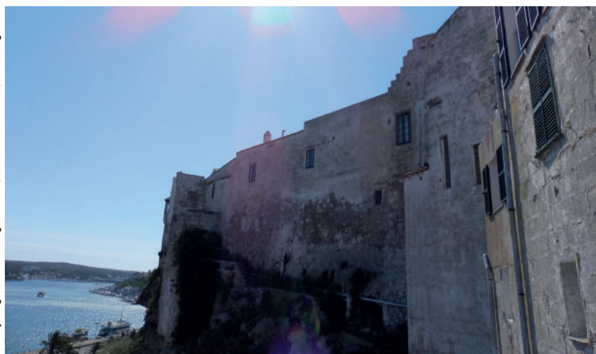
El Monestir sobre el penya-segat del port de Maó - Concepcionistes