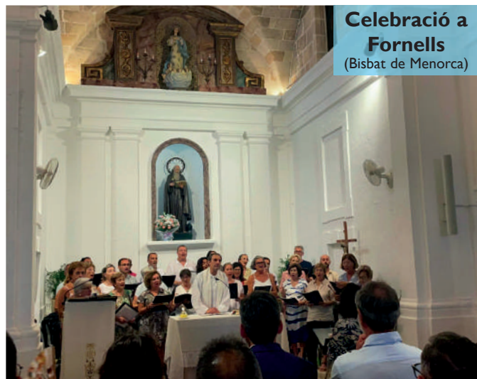
Celebració a Fornells (Bisbat de Menorca)

“Som una Església sinodal, caminam junts. Hem d’avançar i navegar junts, sense deixar ningú enrere i enriquir-nos mútuament. Que la Mare de Déu del Carme, Stella Maris, intercedeixi per nosaltres i sigui font de consol i de perseverança per a tots”, va concloure el Bisbe.