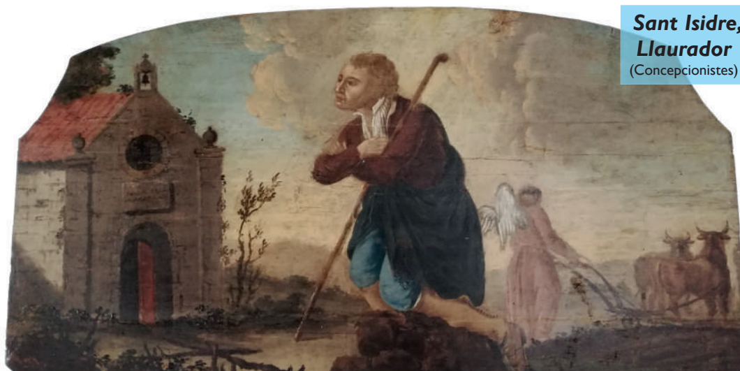
Sant Isidre, Llaurador (Concepcionistes)