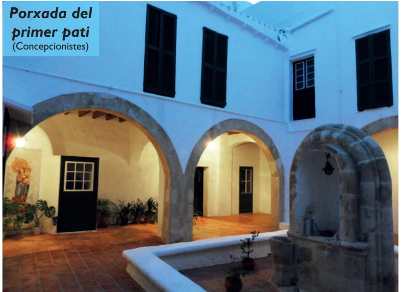
Porxada del primer pati (Concepcionistes)

Maó— per a aconseguir el do de la pluja. Ara bé, seguint l'exemple d'aquestes religioses, intentem no quedar-nos en la superfície del problema, perquè la causa de la sequera més greu i més pertinaç que sofreix la nostra societat d'avui no és la manca d'aigua líquida, sinó la falta d'aigua de Gràcia. En efecte, són moltes en l'actualitat les persones que necessiten tornar a escoltar les paraules que Jesús adreça a la samaritana al costat del pou de Jacob: «tots els qui beuen aigua d'aquesta tornen a tenir set. Però el qui begui de l'aigua que jo li donaré, mai més no tindrà set: l'aigua que jo li donaré es convertirà dintre d'ell en una font d'on brollarà vida eterna» (Jn 4,13-14).