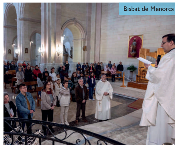
Bisbat de Menorca

Les misses van ser molt participades pels pares, fillets i joves de catequesi, recreant aquest moment de l'Evangelí, amb una xarxa plena de peixos col·locada al presbiteri de les esglésies, juntament amb el lema de la jornada “Des d'ara seràs pescador d'homes.” Trobareu més fotografies a la pàgina web del Bisbat de Menorca.