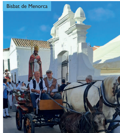
Bisbat de Menorca

El seu instrument de tortura, l'àncora, a la qual Sant Climent va ser fermat i llançat al mar i que el va portar a una mort cruenta, esdevé transformada en símbol d'esperança. És l'estat propi del cristià, aquell qui espera en les promeses de Crist. No oblidem la devoció que ha suscitat Sant Climent a la nostra illa durant la història. El poble es va entregar amb aquesta celebració. El dijous dia 23 de novembre es va celebrar una solemne Eucaristia en el dia de la seva festa, que va acabar amb una bereneta de convivència i germanor.