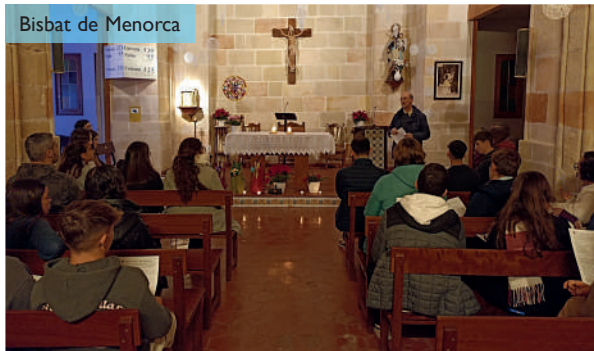
Bisbat de Menorca

El 29 de desembre un grup de joves es va reunir al Centre Catequístic de Sant Miquel, a Ciutadella, per a viure una estona de pregària i reflexió per a preparar-se espiritualment per al nou any. La trobada, que va ser preparada pel Secretariat Diocesà d'Infància i Joventut, es va inspirar en les paraules "Vosaltres sou la sal de la terra, vosaltres sou la llum del món" de l'Evangeli de Sant Mateu.