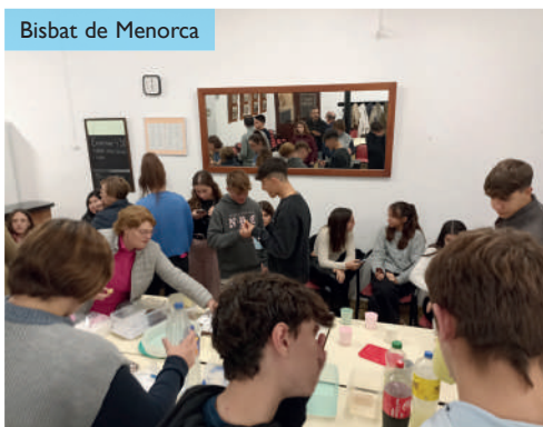
Bisbat de Menorca

Després de la lectura d'aquest fragment, es va repartir un poc de sal a cada un dels participants, i se'ls va convidar a reflexionar què ens vol dir Jesús amb aquest Evangeli. El grup va manifestar que amb aquest missatge Jesús ens crida a ser llum i sal d'esperança amb les persones que ens trobam cada dia, a deixar una bona petjada en el món, fer el bé, crear una bona convivència en l'àmbit familiar, ajudar els amics i a qui més ens necessita. La trobada va acabar compartint una bereneta i una estona de diàleg i convivència.