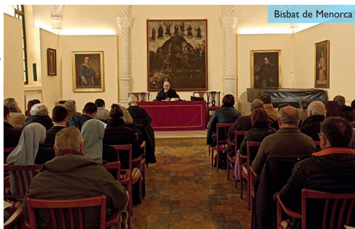
Bisbat de Menorca

obrir un espai de diàleg, en el qual els catequistes van compartir les seves reflexions, destacant que tots hem rebut la gràcia de Déu, que l'esperança és un signe de comunió real amb el Senyor i que la Quaresma és un camí cap a un món nou, per a fer realitat el Regne d'Amor.