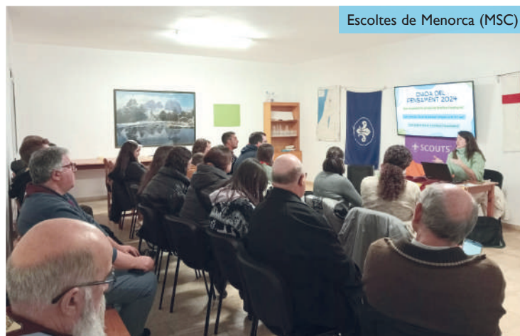
Escoltes de Menorca (MSC)

xerrada relacionada amb les conclusions del treball d'investigació sociològica realitzat per Marta Coll i el seu equip sobre la implicació dels joves de Menorca en les associacions de diferents àmbits.