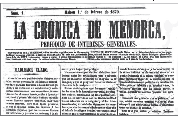
Portada del primer número de La Crònica de Menorca