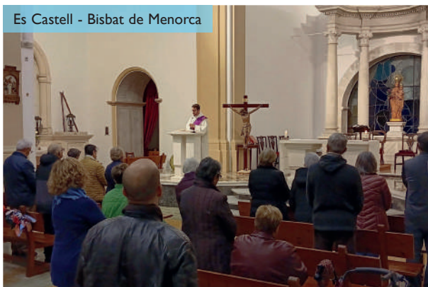
Es Castell - Bisbat de Menorca

vidar a tots els presents a descobrir que l'amor de Déu és un amor entranyable i que la creu, que és fruit d'aquest amor, és una arbre que dona vida, és un arbre fecund, i ens convida a nosaltres a donar vida amb tot el que feim i som. A Maó, al final de la celebració es van beneir les medalles dels nous confreres i dels qui enguany celebren 25 o 50 anys de pertinença a la confraria. Després de les misses, es va acabar la jornada amb una mica de convivència festiva.