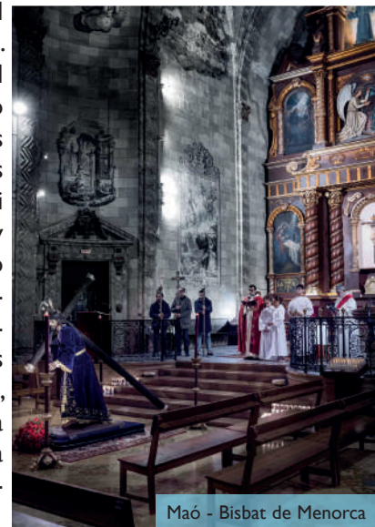
Maó - Bisbat de Menorca