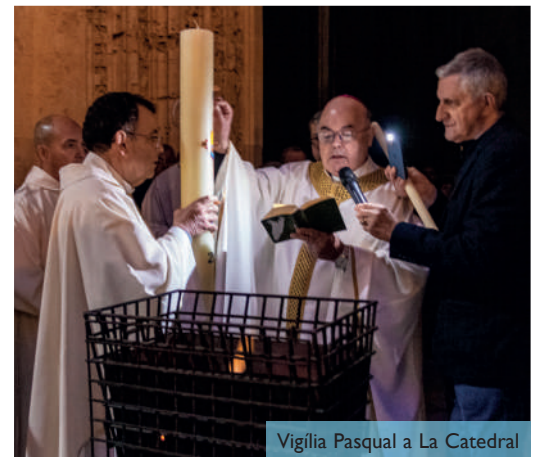
Vigília Pasqual a La Catedral