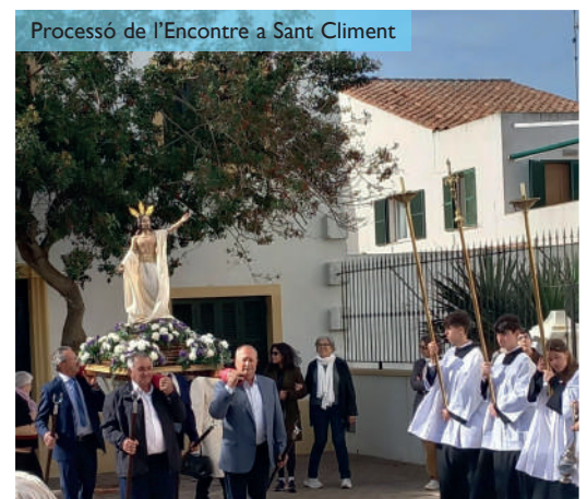
Processó de l'Encontre a Sant Climent

Trobareu més informació i fotografies de la Setmana Santa a la pàgina web del Bisbat de Menorca (bisbatdemenorca.org).