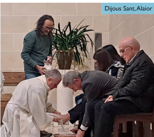
Dijous Sant, Alaior