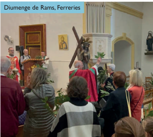
Diumenge de Rams, Ferreries