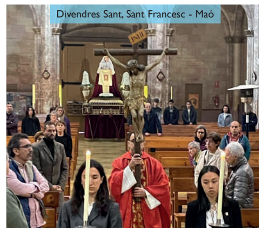
Divendres Sant, Sant Francesc - Maó