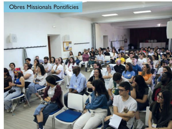
Obres Missionals Pontífiques

dinàmiques, i moments de pregària, amb l'Eucaristia com a eix central de cada jornada. Al canal de Youtube OMP España podeu veure algunes de les conferències que es van fer.