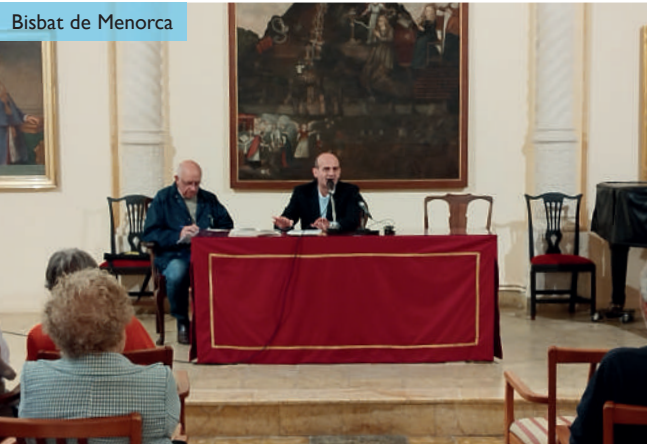
Bisbat de Menorca

fidelitat a l'Evangelí i que, per a la realitat eclesial actual, aquest document aporta a l'evangelització una visió sinodal, perquè com va dir el frare dominic Sant Ramon de Penyafort, "el que a tots afecta ha de ser tractat per tots".