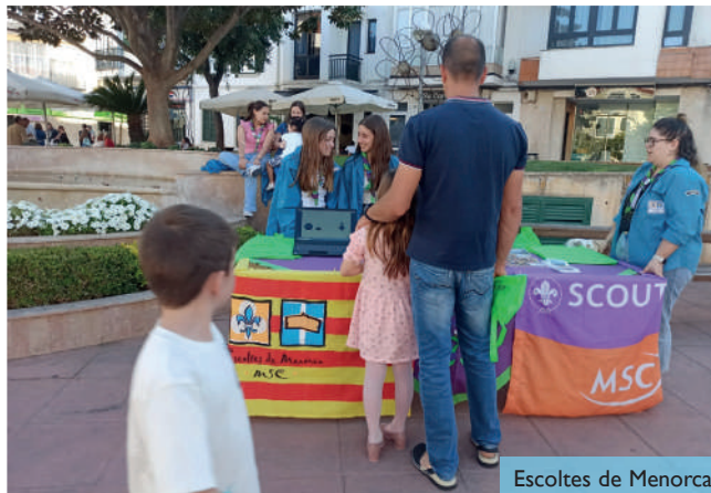
Escoltes de Menorca

en la cura dels espais públics. Aquesta iniciativa sorgeix de l'observació a tots els pobles d'acumulació de brutícia i deixalles; per distraccions o fruit d'actes vandàlics que afecten el mobiliari urbà i altres equipaments públics.