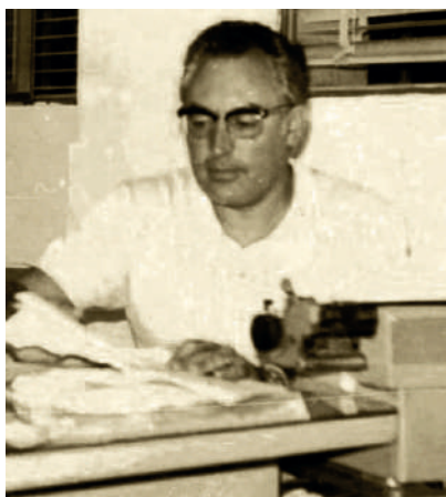
A la redacció d'"El Correo de Andalucía". 1974

El 1955 finalitzà els estudis a Madrid. Desplegà l'ofici en la ràdio i la premsa. Actuà de redactor en diverses etapes en el El Correo de Andalucía , primer com a confeccionador (1958-1970) i, després, redactor en cap (1970-1976). El diari pertanyia llavors a l'arxidiòcesi sevillana, fundat el 1899 pel cardenal beat Marcelo