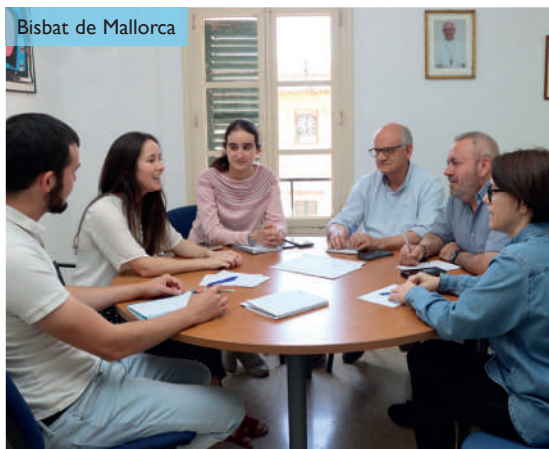
Bisbat de Mallorca

Un dels punts principals va ser valorar la feina conjunta que realitzen les tres diòcesis a l'hora de preparar els programes "Temps de Creure" d'IB3 ràdio (88.6 FM) i "Mosaic" d'IB3 Televisió. En aquest sentit, el grup va organitzar la preparació de nous continguts que s'emetran el pròxim curs i també es van compartir experiències diocesanes i línies d'acció per a reforçar una comunicació autèntica i efectiva com a eina essencial en la missió evangelitzadora de l'Església.