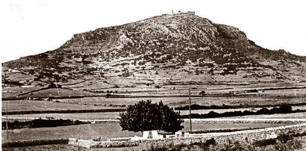
Santuari de la Mare de Déu del Toro - Vista general - Foto: L. Rolsin

► En el curs dels segles XIV, XV i part del XVI , el govern religiós del santuari com a capella i oratori, passa a mans del clero secular menorquí, però no pas al regular. Són anys de manca d'estabilitat i de