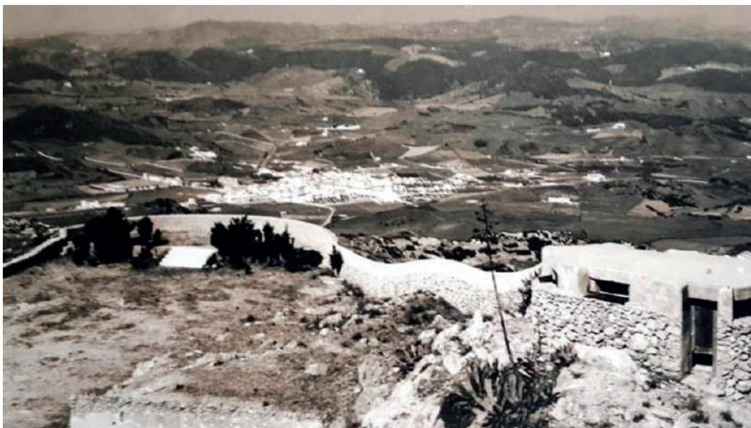
Vista d'Es Mercadal des de dalt la Muntanya

► 19 de maig de 1493 . La Universitat d'Alaior fa el vot de presentar a la Verge l'anomenat Ciri de ses Rates . Es presentava la Pasqua de Pentecosta, per part de dos majordoms nomenats expressament; i açò, per demanar, anualment, la protecció dels camps de Menorca contra les plagues de rates que malmetien les collites, a vegades gravíssimament. Ja a començament del segle XVI , el ciri era presentat per les quatre universitats menorquines, amb una comissió dita l'Obreria del Ciri de ses Rates, formada per quatre individus, un per cada districte municipal de Ciutadella, Maó, Alaior i es Mercadal-Santa Àgueda. És dona el cas que el 18 de març de 1792 , els jurats de la Universitat des Mercadal, en una comunicació enviada al prior del Toro, li demanaren que, en la finalització de cada any, li fossin tornades a la localitat les restes del ciri de ses rates. A més informaren els mercadalencs que tenien la intenció de no donar més que 2 lliures i 10 sous per als oficis que es cantaven en el dia de la presentació de l'esmentat ciri. El prior d'aleshores, el Pare fra Agustí Pons, no admeté les innovacions proposades.