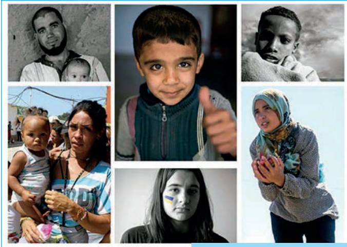
Conferència Episcopal Espanyola