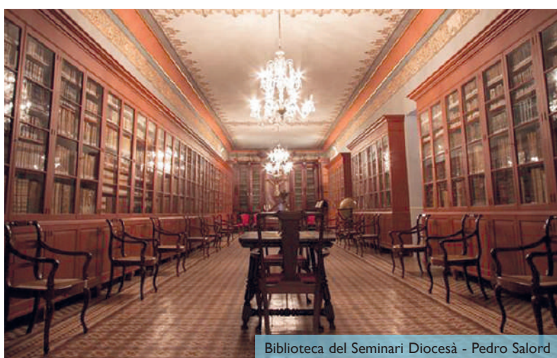
Biblioteca del Seminari Diocesà - Pedro Salord

Aunque la era de la informática, de la inteligencia artificial, de las redes sociales, la nube, los teléfonos inteligentes, los soportes magnéticos diversos... desplacen hoy al libro impreso, es solo apariencia, pues asistimos a la edición de títulos nuevos y a la reedición y publicación de cantidad de innumerables temas... un mundo lleno de ofertas y de novedades para los que amamos los libros.