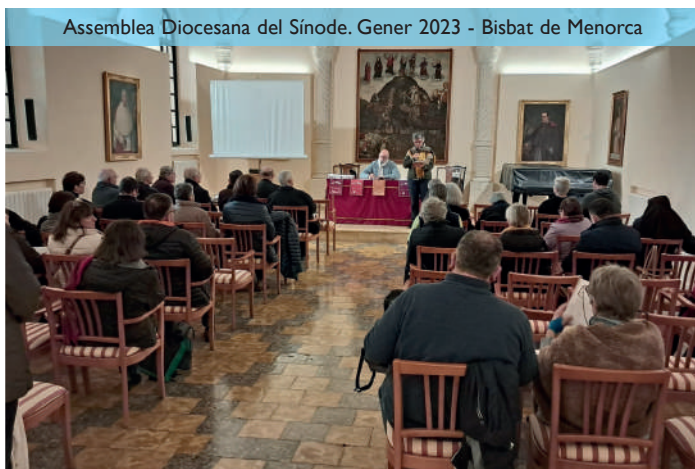
Assemblea Diocesana del Sínode. Gener 2023 - Bisbat de Menorca

camí de l'Església, el paper de les dones i del laicat a la vida i a la missió de l'Església o el treball per a una Església que escolta i acompanya.