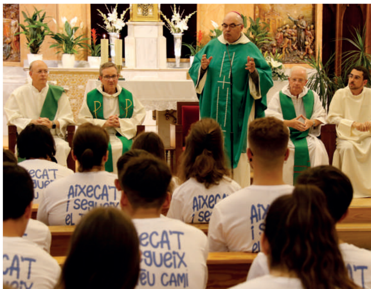
Eucaristia d'Enviament joves de Menorca a la JMJ de Lisboa, juliol 2023 - Toni Barber

E n Europa estamos viviendo un declive significativo de la fe, puede ser por exceso de familiaridad (lo que llamaríamos muerte por éxito). A los nazarenos les ocurrió algo semejante, cuando el Señor fue a predicar a su sinagoga aquel sábado en el que ellos se preguntaban de dónde le venía esa sabiduría... Se escandalizaron de Él aludiendo que le conocían, que era el hijo del carpintero, el hijo de María y que sus familiares eran conocidos por todos... Al igual que Jesús nació en Belén pero se crió en Nazaret, podemos decir que el cristianismo nació en Asia pero se crió en Europa. Tenemos acceso ilimitado a los sacramentos, para otorgar un simple dato: en Ciutadella solo los domingos, se celebran quince Misas. Es decir, tenemos muy fácil acceso al núcleo central de nuestra fe, la Eucaristía.