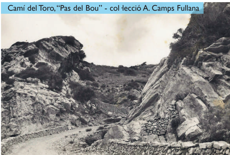
Camí del Toro, "Pas del Bou" - col·lecció A. Camps Fullana