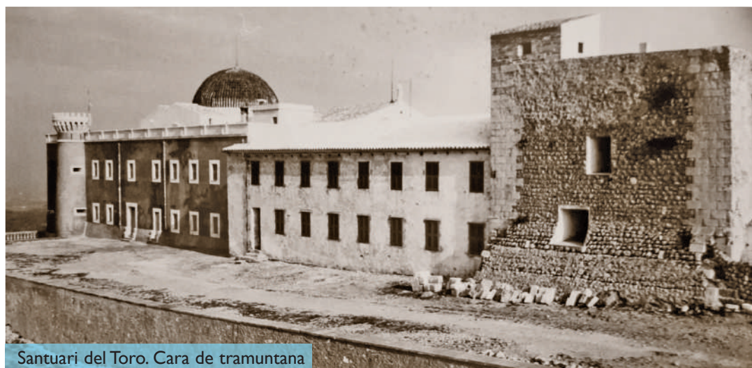
Santuari del Toro. Cara de tramuntana

► 7 de novembre de 1798. Just en rompre el dia, el vigia del Toro hagué de donar les preceptives senyals d'alarma, per com hi havia divisat un estol enemic. Els vaixells desconeguts navegaven cap a Menorca, en direcció a les costes de tramun-