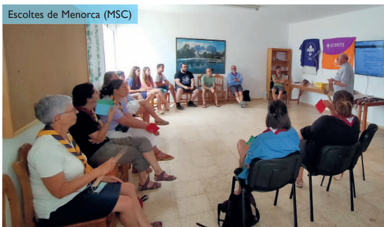
Escoltes de Menorca (MSC)

l'entitat diocesana per la seva tasca voluntària, animant a dur a terme el mètode escolta, què és una font de persones compromeses. L'Assemblea va acabar amb un dinar de germanor.