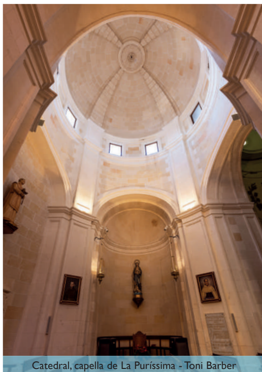
Catedral, capella de La Puríssima - Toni Barber