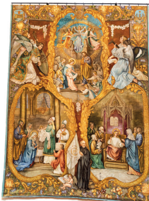
Un dels tapissos de les capelles laterals de la nau