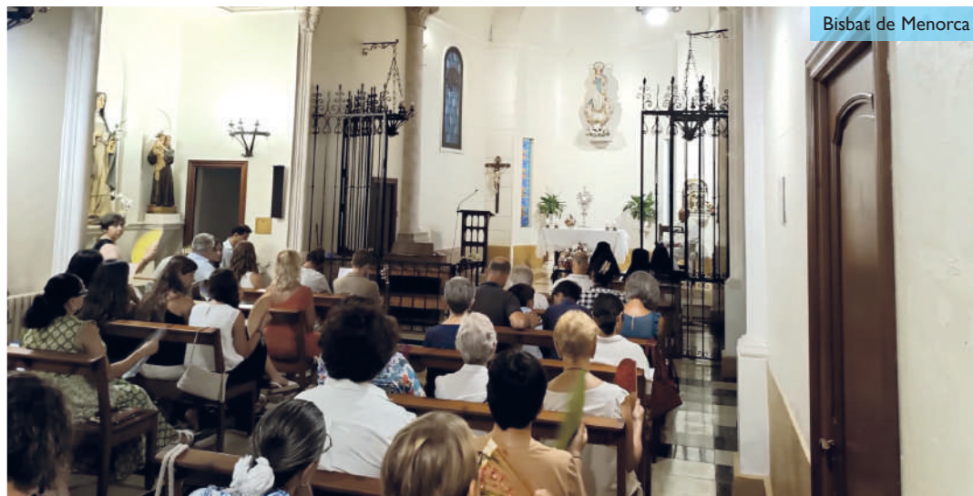
Bisbat de Menorca

i participa habitualment a les hores santes que organitza el moviment Hakuna en aquesta ciutat. Va ser llavors quan va sorgir la idea de preparar una Hora Santa a l'estil d'aquest moviment que es caracteritza per aprendre a viure arrossegats davant Crist hòstia, davant el proïsme, davant la vida i davant el món.