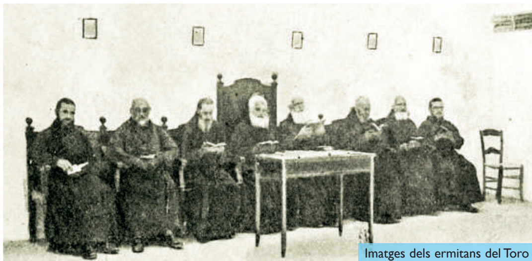
Imatges dels ermitans del Toro