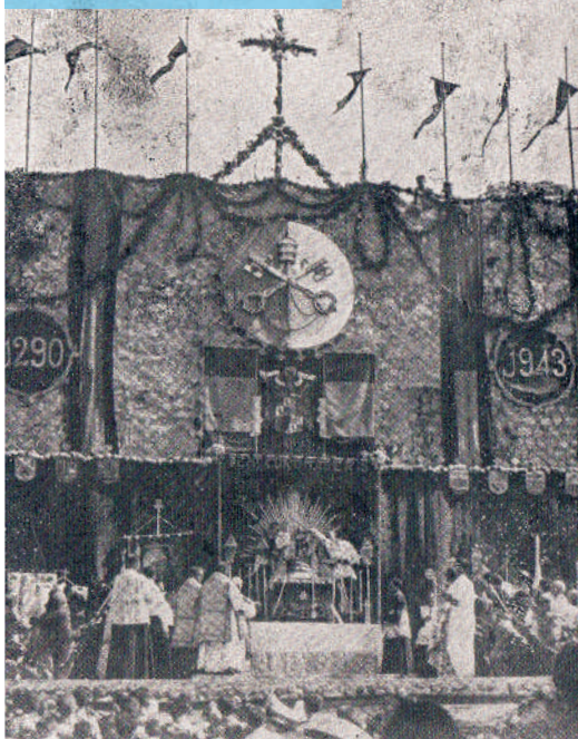
Coronació Pontifícia de la Mare de Déu del Toro