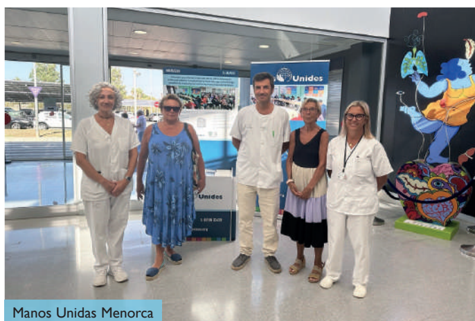
Manos Unidas Menorca

El proyecto ha promovido la empleabilidad y la inserción sociolaboral de los jóvenes que han finalizado sus estudios superiores de formación profesional y que encuentran dificultades de acceso a un trabajo o al emprendimiento. Su situación se ve agravada por las circunstancias sociocomunitarias presentes en los barrios ubicados en zonas periurbanas de la ciudad de Tetuán, como el de Taboula-Nakala, que cuenta con elevados índices de exclusión social y antecedentes de radicalización violenta.