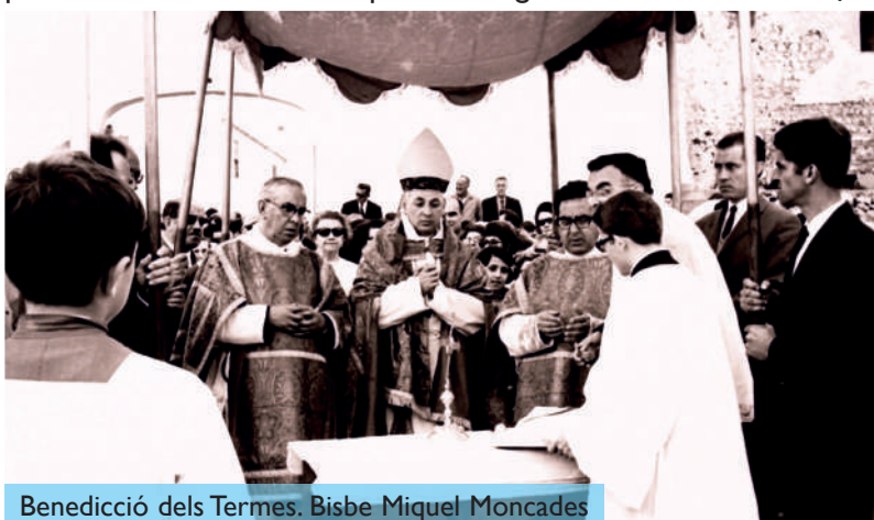
Benedicció dels Termes. Bisbe Miquel Moncades