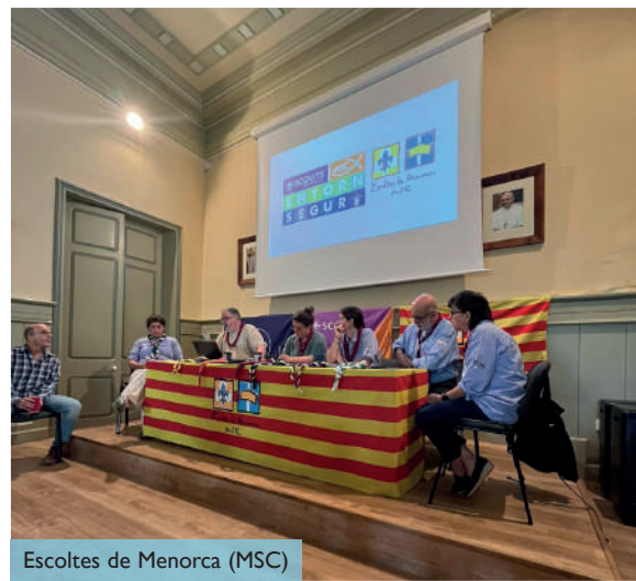
Escoltes de Menorca (MSC)

Un altre dels punts de l'ordre del dia va ser l'aprovació del pressupost per 2025. Finalment, un punt que es va afegir, i que el plenari en va donar el seu sí, va ser formar part de la nova Federació d'Entitats de Lleure Educatiu de les Illes Balears (CRUÏLLA)