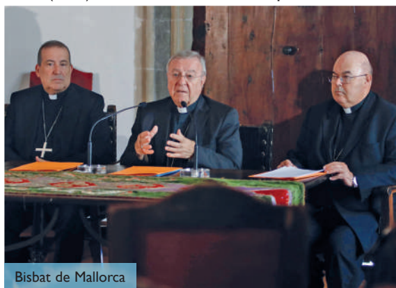
Bisbat de Mallorca