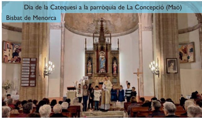
Dia de la Catequesi a la parròquia de La Concepció (Maó) Bisbat de Menorca

Aquesta actitud individualista també es trasllada a l'àmbit de la fe. No podem dir que no hi hagi fe avui en dia, però la dimensió comunitària de la fe sí que està en crisi. Només fa falta veure el número de persones que participen en les celebracions de l'Eucaristia i en els grups parroquials. Volem viure una fe individual, sense pertinença a cap