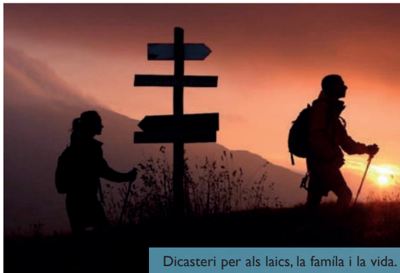
Dicasteri per als laics, la família i la vida.

En un procés de discerniment vocacional és important la capacitat de fer-se preguntes. Actuar amb sinceritat intel·lectual i espiritual per tal de poder trobar respostes a aquells interrogants que duim dins el cor. Malauradament, costa detectar entre el jovent aquesta inquietud intel·lectual, aquestes ganes de fer-se preguntes. Vivim bastant anestesiats amb les xarxes socials, llegim poca