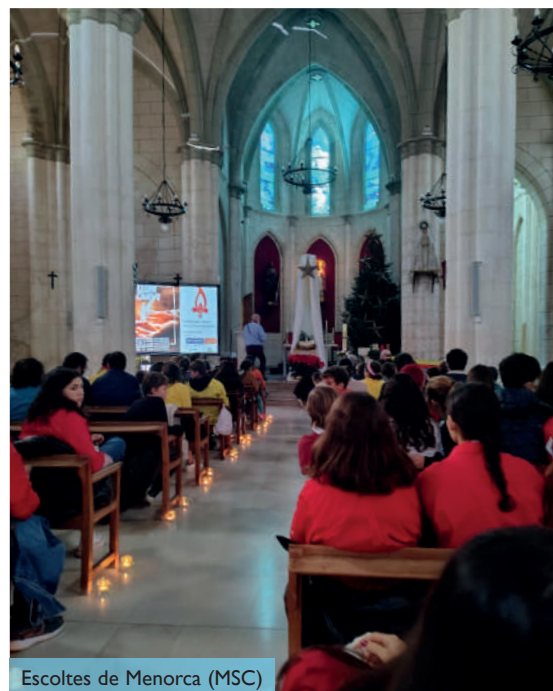
Escoltes de Menorca (MSC)