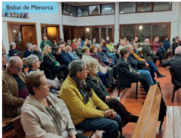
Bisbat de Menorca

Les portes de l'Advent, dia 30 de novembre, es va presentar, a la parròquia de Sant Esteve (Ciutadella), el nou llibre del prevere J. Bosco