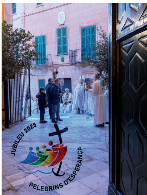
Acte d'inici del Jubileu a la Catedral de Menorca el passat diumenge 29 de desembre.

Durant aquest temps molts seran els actes que es celebraran, no menys significatiu serà concretament el 25 de març, dia que Jesucrist per obra de l'Esperit Sant començà a ser concebut en el sinus immaculat de Maria. Aquest dia agraiem especialment que la vida comença en el moment de la concepció i l'ésser menut i fràgil és ja distint dels seus progenitors tenint una vida digna de tot reconeixement i respecte.