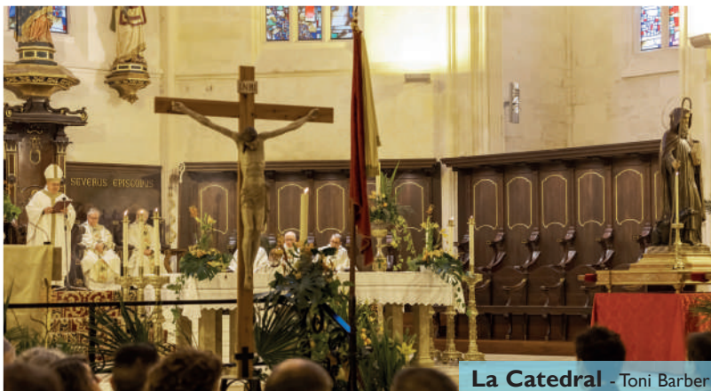
La Catedral - Toni Barber

A la Maó, a la parròquia de Sant Antoni, s'han celebrat cinc dies de culte al sant. Dia 16 de gener es va acompanyar el penó de Sant Antoni fins a la parròquia i després es va fer una torrada popular. Dia 17 de gener es va celebrar l'Eucaristia i, tot seguit, va sortir la processó i es va celebrar la beneïda d'animals al carrer de Ses Moreres. També es van celebrar misses en honor a Sant Antoni i beneïdes a Migjorn Gran, es Mercadal, Fornells, es Castell, Sant Climent i Sant Lluís. La missa de la Catedral es pot tornar a veure al canal de Youtube del Bisbat de Menorca.